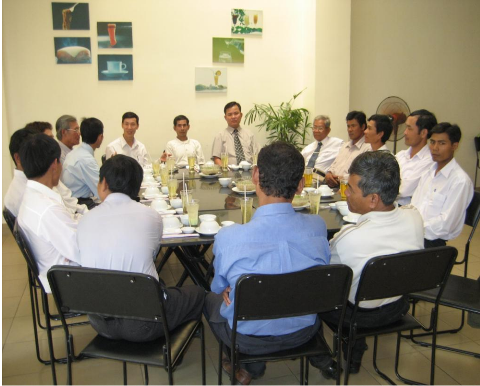
Ngày 12/02/2008 Thông công ban thường trực VPEF