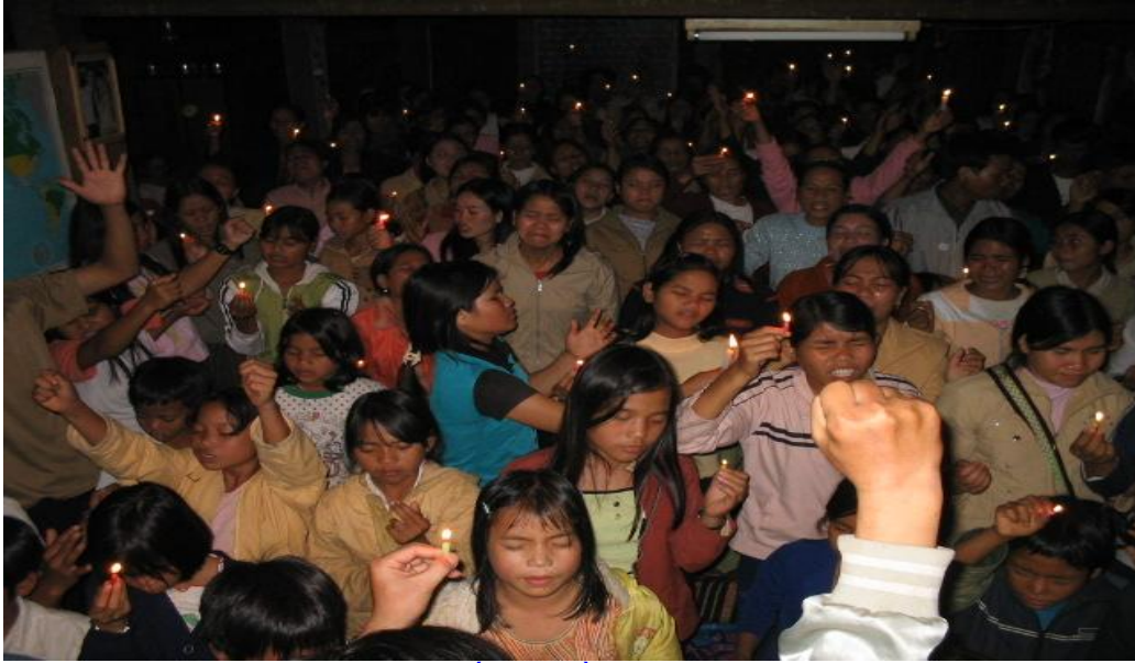
Hội thánh UMCC/VPEF Pleimonu thắp nến cầu nguyện cho tự do tôn giáo và nhân quyền.