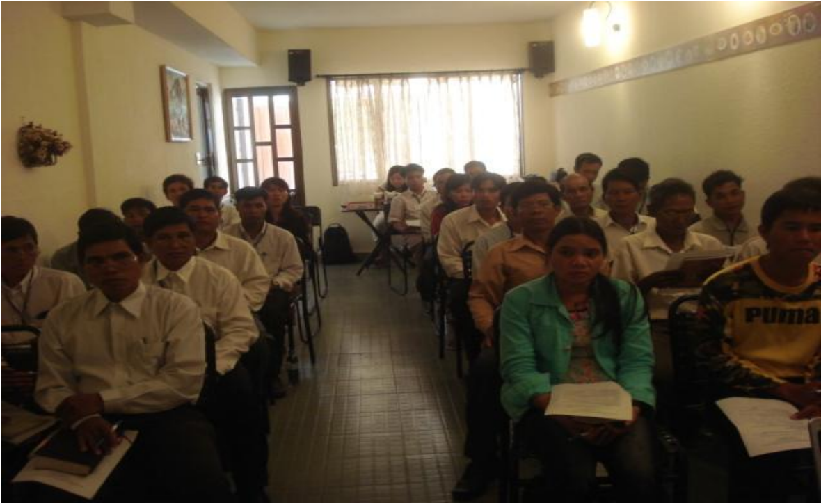
Lớp Mục vụ UMCC/VPEF