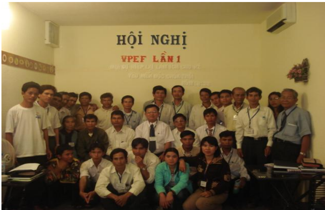
Ngày 15/11/2007, Hội nghị VPEF lần thứ nhất có 46 Mục sư đại diện 22/54 sắc tộc tham dự,