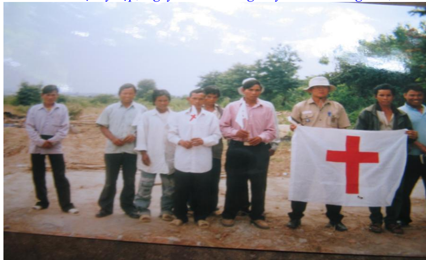
Ngày 16/1/2004 chính quyền tỉnh Kon tum tiếp tục huy động lực lượng ủi sập nhà nguyện lần 2, tịch thu sạch tài sản (Cạn tàu ráo máng) không để 1 thứ gì lại. Hội thánh đến cầu nguyện trên nền nhà nguyện cũ.