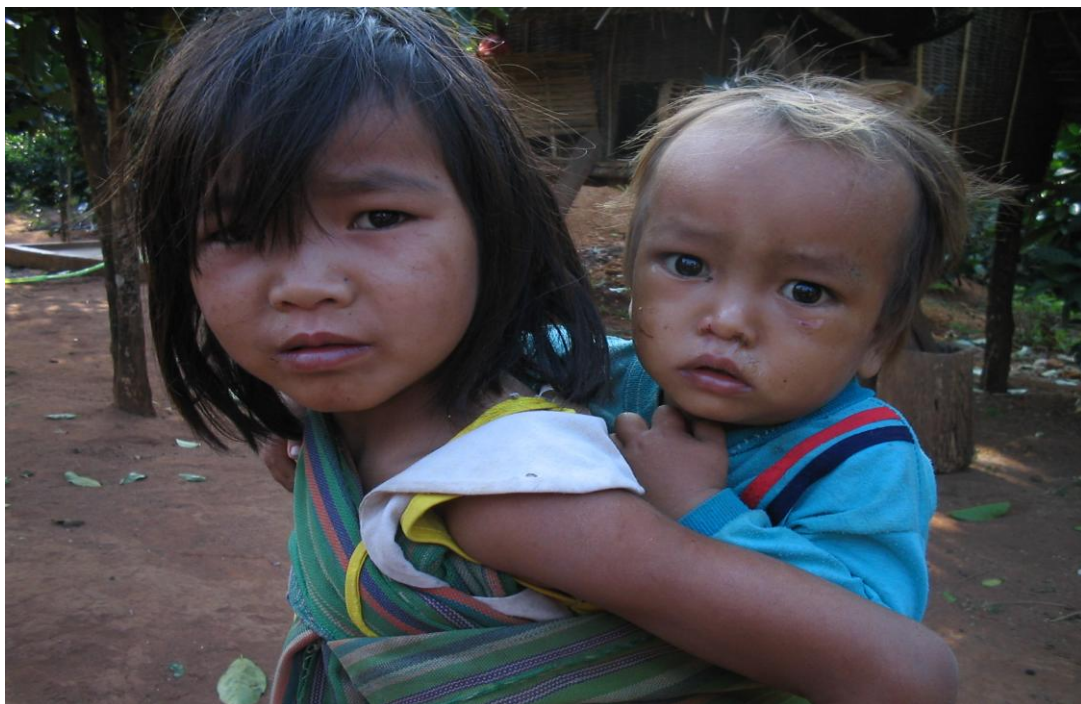
Jesus Christ: Hãy để con trẻ đến cùng ta, đừng ngăn cản chúng nó!