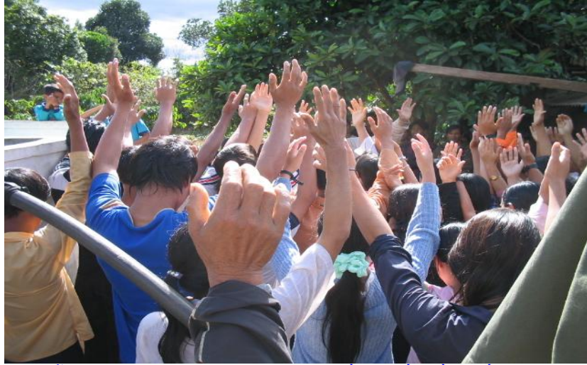
Một lần làm lễ báp tem ở Hội thánh Pleimonu, đồng chết, đồng sống với Jesus Christ.