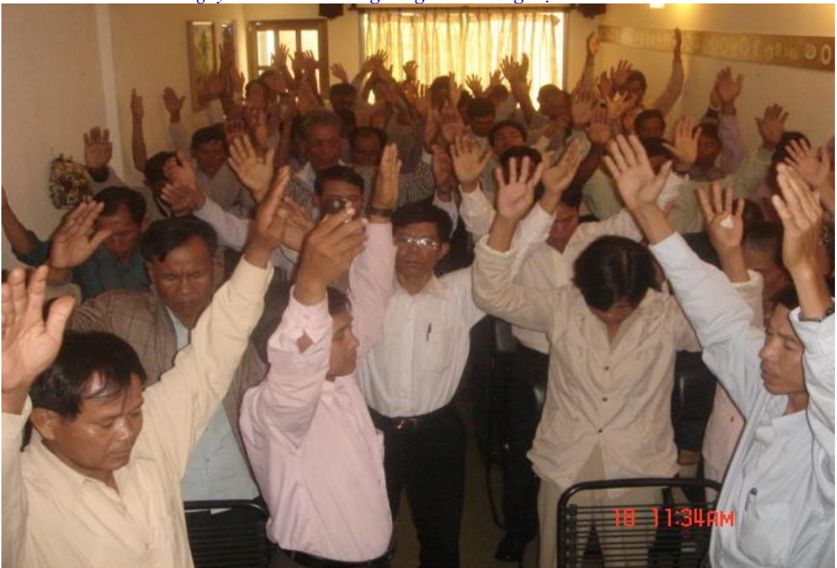
Ngày 18/08/2008, thành lập Giáo hội Liên hữu Tin lành Đấng Christ các dân tộc Việt nam (UMCC)