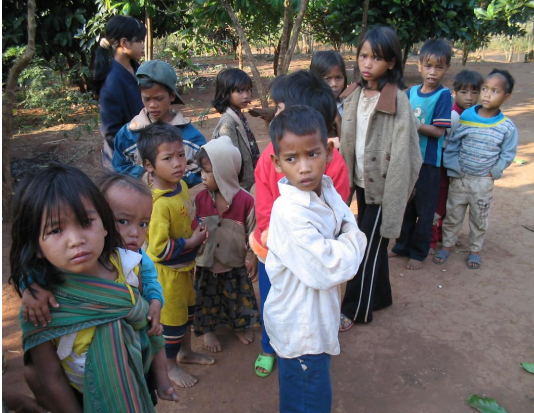
Chúa Giê-xu ôi! Xin cho ba con được về nhà! Một Hội thánh ở Tây Nguyên chỉ còn lại trẻ em và phụ nữ, còn đàn ông thì bị công an bắt hết rồi.