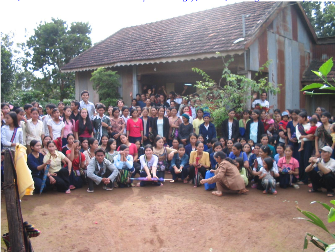
Hội thánh Pleimonu, UMCC/VPEF cầu nguyện mỗi chúa nhật (Nhóm sắc tộc Jarrai)