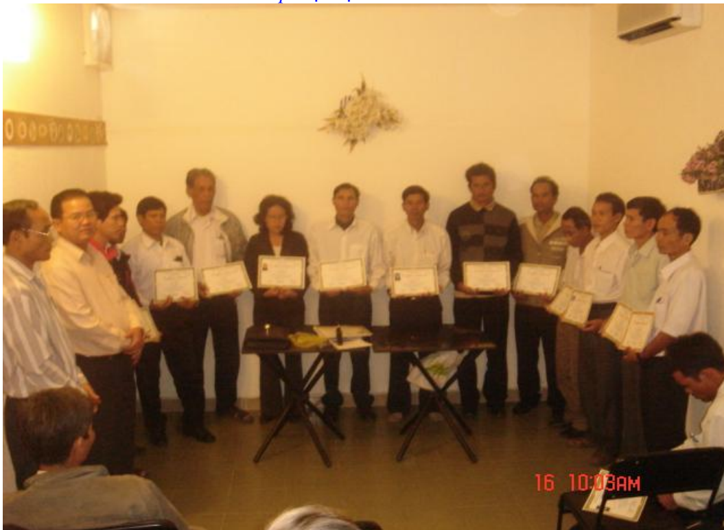
Ngày 15/01/2009, UMCC/VPEF làm lễ cấp chứng nhận Mục sư cho các Mục sư ban đại diện,