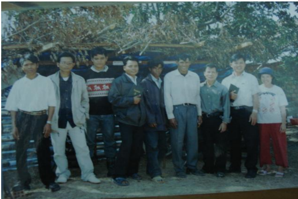
Sau khi nhà nguyện bị ủi sập lần thứ nhất, 24/9/2009. anh em tín hữu lưu giữ những tấm tôn và cây gỗ còn sót lại làm một cái chòi để gia đình Mục sư Chính ở tạm và Hội thánh tiếp tục nhóm lại,